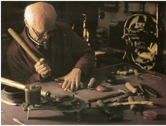
Doratura a mano – Handmade decoration with gold