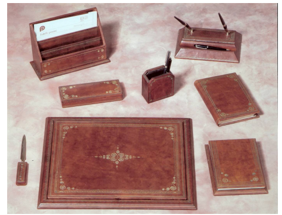
Set da scrivania – Desk set